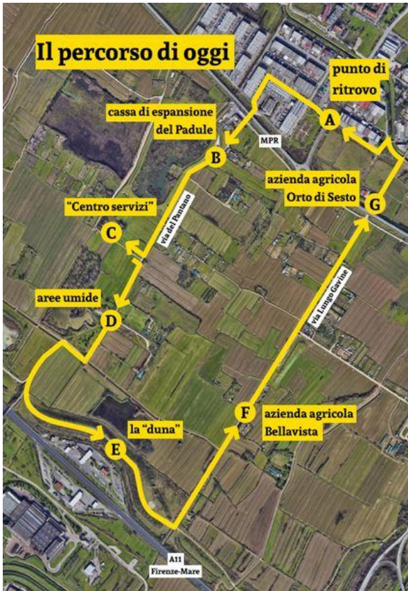
mappa con domande - trekking Parco della Piana