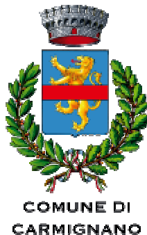
COMUNE DI CARMIGNANO