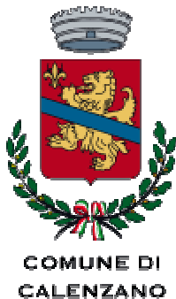
COMUNE DI CALENZANO