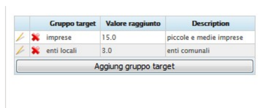
Figura 11. Correggere o eliminare informazioni già inserite nelle varie tabelle

Per eliminare per intero un campo già inserito, si prega di utilizzare la X rossa.