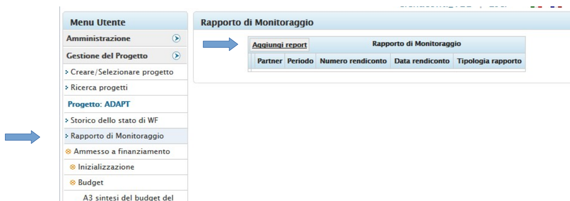
Figura 1. Sezione Rapporto di monitoraggio - Aggiungere un Report di monitoraggio

Al Rapporto di monitoraggio si accede da una sezione apposita del SI dello stesso nome presente sul Menù di sinistra del SI sez. Marittimo.