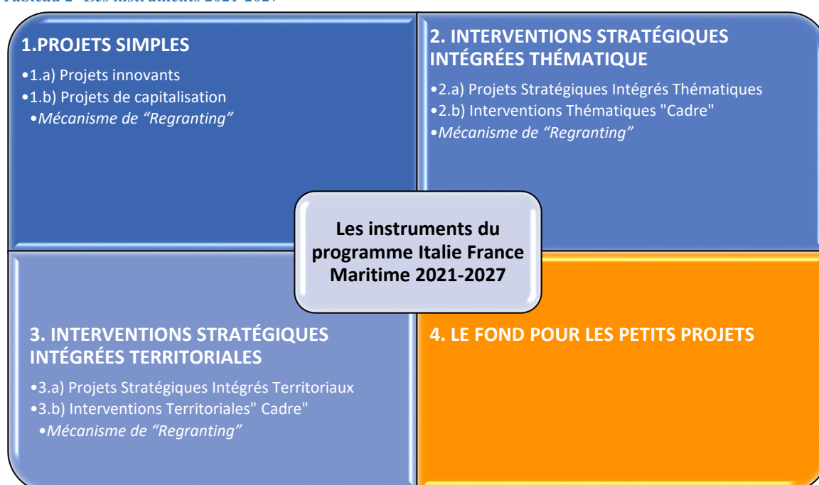
Tableau 2- Les instruments 2021-2027

Il y a ensuite un autre input que l'on souhaite recueillir et qui vise à relever, afin de valoriser davantage, les particularités de territoires spécifiques ou de thèmes particuliers, pour lesquels des interventions ad hoc plus articulées sont nécessaires. En réponse à ce deuxième input, nous proposons une évolution des projets stratégiques prévues dans la programmation 2014-2020 à travers des Interventions Stratégiques Intégrées Thématiques/Territoriales qui seront articulées dans les Projets Stratégiques Intégrés Thématiques/Territoriaux déjà expérimentés et avec le renforcement/redéfinition des Interventions Thématiques/Territoriales Cadre . Le tableau suivant résume les instruments proposés pour la programmation 2021-27.