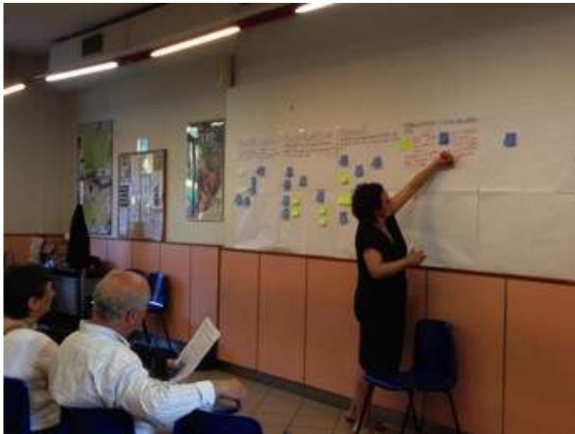
Report incontro Associazioni

L'area parco è ricca di realtà e attività importanti radicate sul territorio come: il vivaio Belfiore, la Coop. Legnaia, il Parco di Poggio Valicaia, l'azienda agricola biologica Fattoria di San Michele a Torri, la Villa