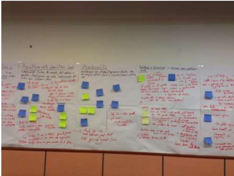
Report incontro Associazioni