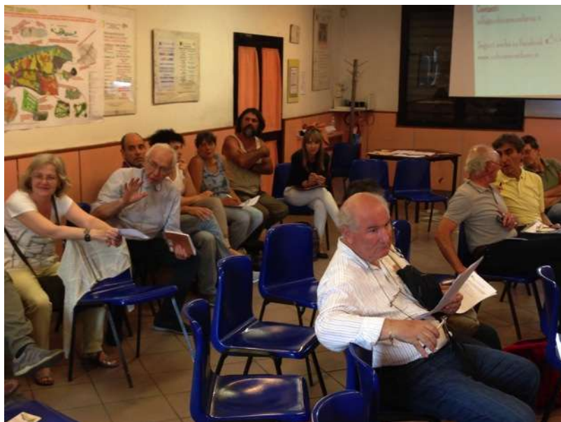
Report incontro Associazioni

Toscana. Pone i problemi dell'area del futuro parco agricolo tra i quali la vulnerabilità idrogeologica e l'inquinamento dei suoli. Riporta che molte parti del territorio sono da bonificare, prima di fare agricoltura. Ci sono molti studi (ricerche, tesi di laurea). Parla dell'ingresso delle mafie nel giro d'affari della movimentazione terre. Nello scavo per l'acquedotto sulla Greve ad esempio hanno trovato diverso materiale di scarto. Il parcheggio di via del Sansovino è fermo per una indagine della magistratura a causa di alcuni materiali ritrovati.