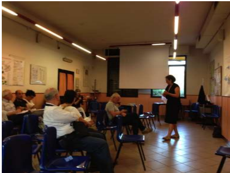
Report incontro Associazioni

contaminazione da Xylella fastidiosa favorita dall'abbandono delle piante a beneficio anche del paesaggio.