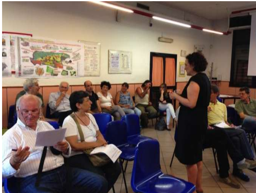
Report incontro Associazioni