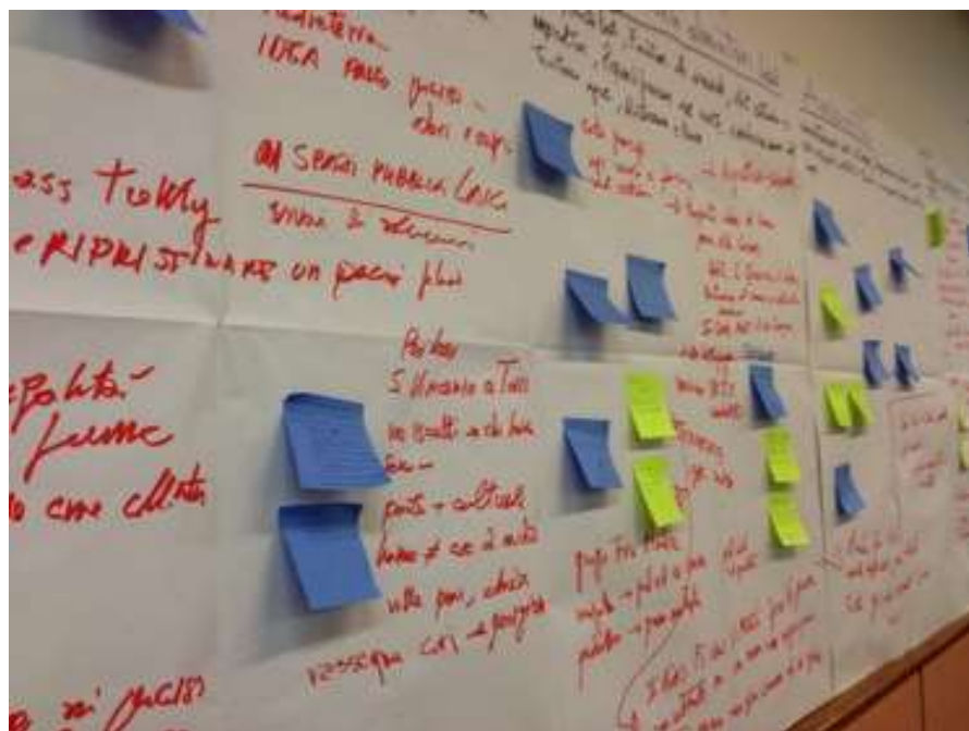
Report incontro Associazioni

Segnala inoltre le diverse strutture componenti del progetto: Gruppo di lavoro universitario, Comitato di Pilotaggio, Comitato Scientifico Multidisciplinare e Struttura Decisionale. Vengono dati i riferimenti internet e FB dove possono essere trovate tutte le informazioni relative al progetto e dove è possibile recuperare e compilare on line il questionario che è stato distribuito anche in forma cartacea.