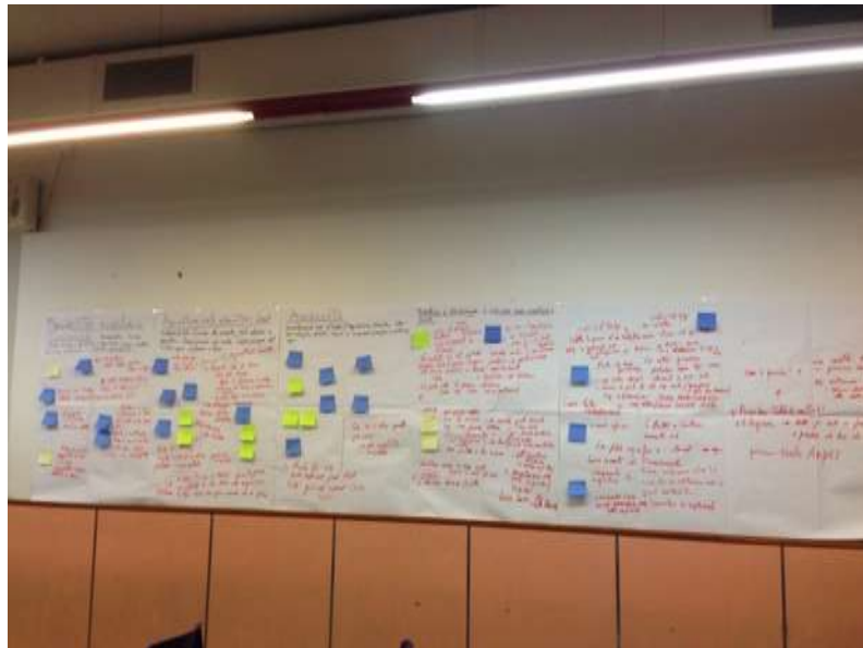
Report incontro Associazioni

sversamento di olii. Viene richiesto il monitoraggio costante dopo la realizzazione dell'area ex Ferrale e III corsia autostradale. Le autorità non hanno ancora risposto. Diminuiscono le centrali di rilevamento degli inquinanti. L'associazione Q4 ha documentazione utile, ma servono i tecnici e capire quali sono le risorse a disposizione. Solleva inoltre il problema rilevante della difficoltà di ricostruire le responsabilità e le competenze degli enti che al momento che vengono interpellati rimandano gli uni agli altri.